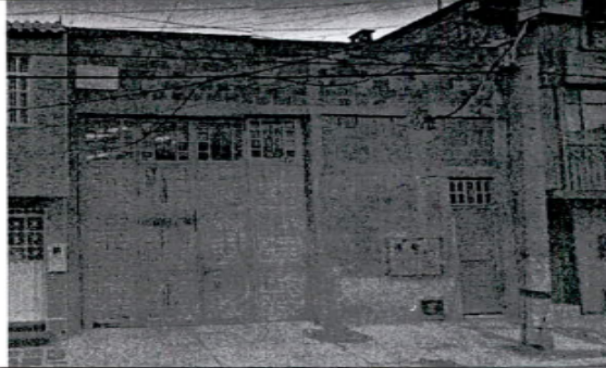
FOTOGRAFIA N°. 1 FACHADA DEL PREDIO.