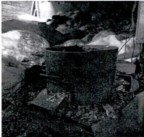
FOTOGRAFIA N°. 3 AREA DE AGLUTINADO