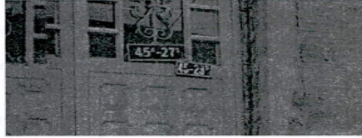
FOTOGRAFIA N°. 2 NOMENCLATURA DEL PREDIO