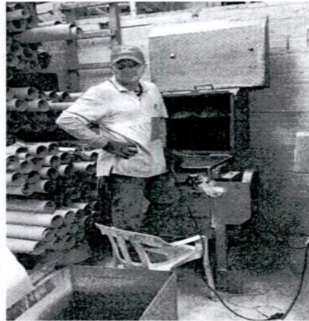
FOTOGRAFIA N°. 4 AREA DE MOLIDO